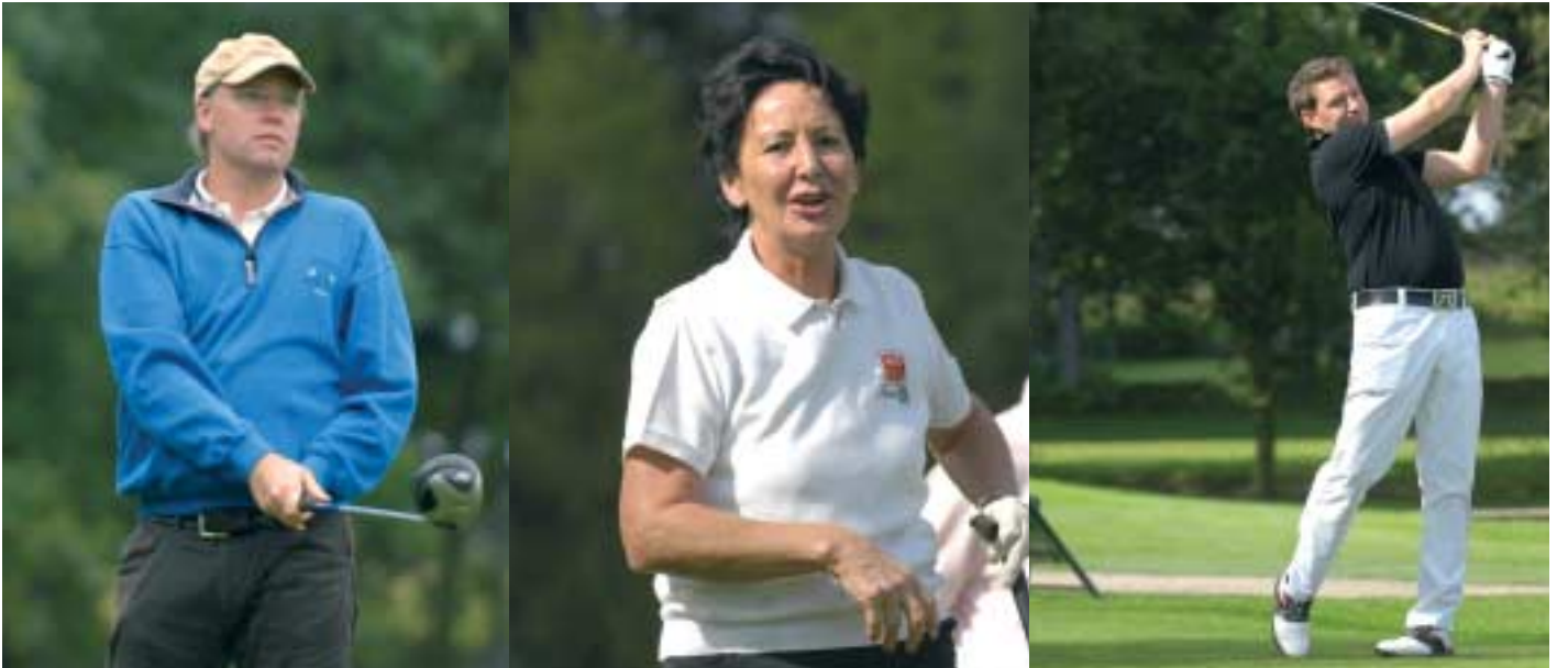
Das Team vom Porsche Zentrum Baden-Baden sagt unseren Finalteilnehmern nochmals „herzlichen Dank und besonderen Glückwunsch“ zur erfolgreichen Teilnahme beim Porsche Golf Cup 2007 Deutschland Finale in Hamburg.